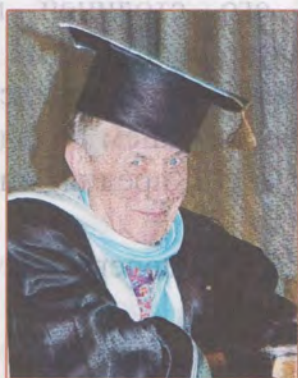
Евтушенко Евгений Александрович